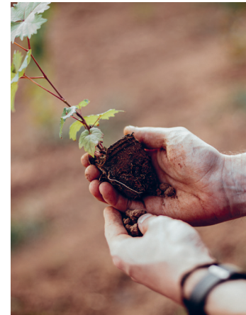
Weingeschichte und Zukunft