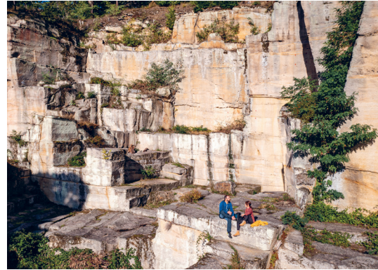
Natur- und Landschaftsführungen