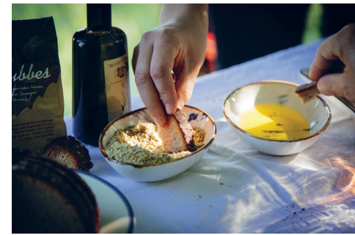
Kulinarik und Genuss